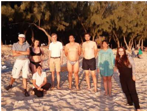
Sur la plaĝo L'Ermitage