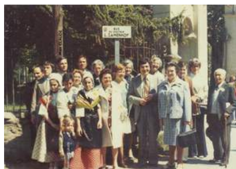
stratinaŭguro en 1975