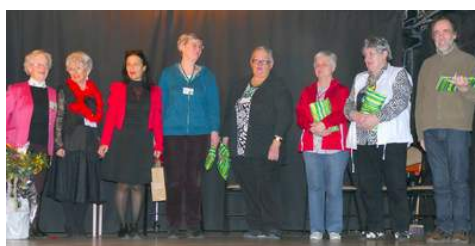
la organizantinoj, kursgvidantinoj kaj ĥorusestro estis varme dankitaj de la tuta staĝanaro