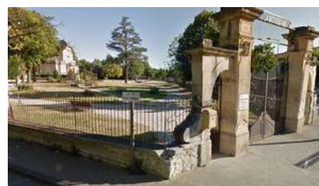
nuna aspekto de la stratplato-loko